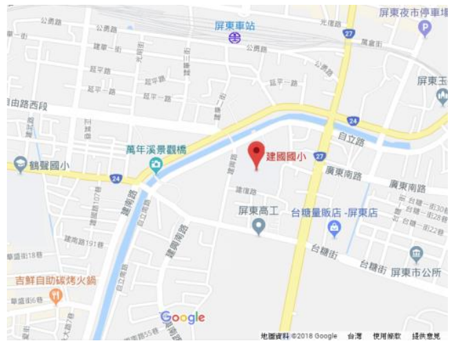
圖 3-1-1 學校地理位置示意圖

本校地處屏東市後火車站萬年溪畔，是隨著屏東市文化歷史變遷一起成長的校園。過去屏東火車站後站區域一直是個低度開發區，舊稱灰窯仔，本校學區內之擇仁、建國、厚生里一帶通稱灰窯仔，早年是靠近萬年溪的河灘地，先民在此建有一座燒石灰的灰窯。日治時期因台灣製糖株式會社阿猴工場成立，需要大批勞動人力，吸引外縣市的鄉親，攜家帶眷來屏東市落地生根。其中，來自台南縣北門郡鄉親，聚居在灰窯仔一帶，大多以趕牛車載運貨物農產為業，故以「牛車掛」稱呼。